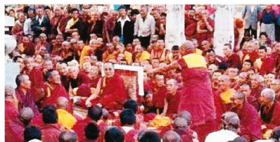
ダライラマ法王と僧たち

<著書> 訳集 ゲルク派版「チベット死者の書」、 新アジア仏教史 チベット「須弥山の仏教世界」 「チベットを知るための50章」など多数