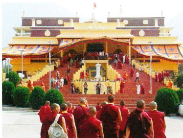
チベット密教寺院(インド ダラムサラ)