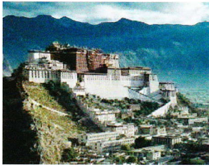
ポタラ宮 (チベット ラサ)